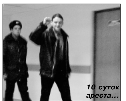
10 суток ареста...

Вместе с представителями КПСС и СКМ едем к ОВД «Тверское». К тому моменту нам уже было известно, что кроме Удальцова там находится 3 человека. Ждем несколько часов. Наконец узнаем, что сейчас ребят повезут в суд. В один голос сотрудники милиции утверждают: «В